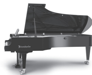
本公演使用ピアノ： ベーゼンドルファー Model 290 Imperial

ベーゼンドルファー社はモーツァルト、ベートーヴェン、シューベルト、リストなど、偉大な作曲家たちが活躍した「音楽の都ウィーン」で1828年に設立されました。「世界三大ピアノ」の中でも最も長い歴史を持ち、190年以上経った今なお、伝統工法を守りながら、オーストリアの工場ですべて1台1台手作業で製作されています。ベーゼンドルファーのあたたかな音色と繊細な“至福のピアノニッシモ”は時代を越えて愛され続けています。