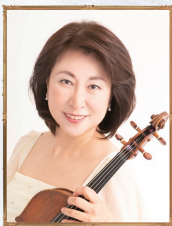
Va. ヴィオラ：大野かおる