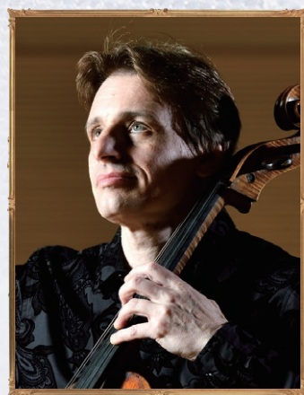
Vc. チェロ：ドミトリー・フェイギン

2024年 5月12日(日) 14:00開演(13:30開場) 東京オペラシティ リサイタルホール